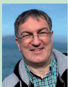
Beiträge für „DXtra“ an:

T32, Eastern Kiribati: Ken, KH6QJ, plant vom 1.9. bis 17.10. wieder als T32AZ von Kiritimati Island (OC-024) QRV zu sein. Betrieb auf 80, 40, 20, 15