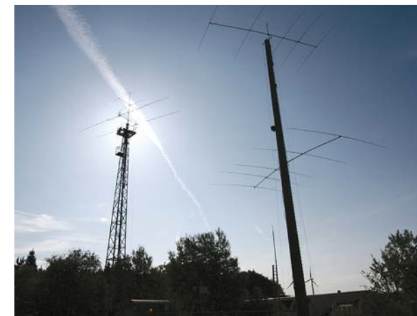
Gittermast links mit 2 EL. 40 m Monobander und FB-33; Betonmast rechts mit 2 x 5 EL. 20 m Monoband