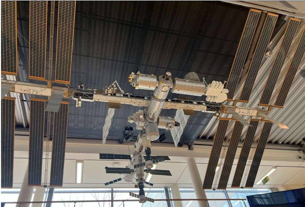
Abbildung 4 Modell der ISS

Die Erzählungen von Guido waren so fesselnd, detailliert und mit einer solchen Begeisterung erzählt, dass man annehmen musste, er wäre selber schon auf der ISS gewesen. In der anschließenden Halle waren die europäischen Module der ISS im Maßstab 1:1 vorhanden und dienen allen ISS Bewohnern und den angehenden Astronauten zum Training. Auch das obligatorische Tauchbecken zum Trainieren der Schwerelosigkeit fehlte nicht.