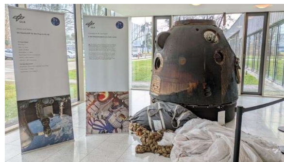
Abbildung 2 Landekapsel 2014

Ein wahrlich heißer Ritt über 5 Stunden und bei 1600 Grad Außentemperatur, eingequetscht und festgezurt mit 2 weiteren Raumfahrern in der engen Kapsel war ein Preis den Alexander wohl gerne für seine sichere Rückkehr zur Erde gezahlt hat.