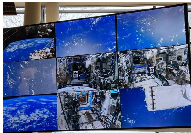
Abbildung 6 Livebilder ISS