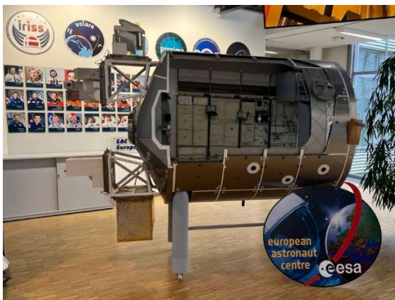
Abbildung 5 Model Spacelab