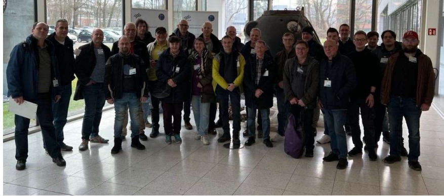
Abbildung 1 Gruppenfoto

Nach Anmeldung über das Webportal des Besucherwesens des DLR Köln und vorzeitiger Übermittlung der Teilnehmerliste war es am 20.2. endlich soweit gewesen. Wir hatten eine der begehrten Führungen erhalten. Nach dem Erhalt der Besucherausweise ging es auf zum Treffpunkt, dem Casino auf dem DLR Gelände. Nur in einigen Bereichen ist das Fotografieren aufgrund der Forschungs- und Entwicklungsarbeiten verständlicherweise erlaubt.