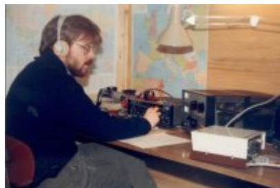
😊 26.3.1988 Teilnahme DL4YAO am WPX-Contest SSB (Bilder 6, 7, 8)