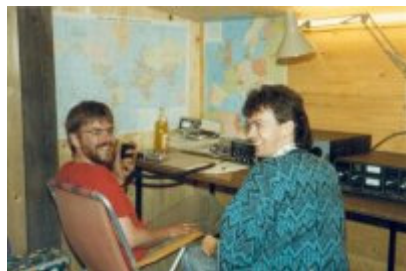
😞 15.8.1988 Eine Distel in der Contest-Hütte deutet auf Flaute hin (Bild 10)