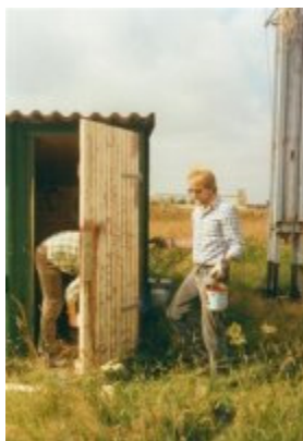
😊 14.10.1989 4. Aufbau des 6-ele-Beams (Bilder 8, 9)