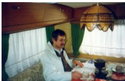
😊 20.3.1988 Teilnahme an der Distriktsversammlung in Paderborn