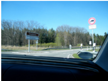
Bild 4 - Die Ausfahrt im zweiten Kreisverkehr, Richtung Kristalltherme