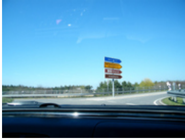
Bild 2 - Einbiegen auf die Brücke über die A9