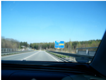
Bild 3 - Auf der Brücke über die A9 - Zufahrt zum zweiten Kreisverkehr