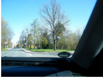
Bild 8 - Zufahrt zum Parkplatz