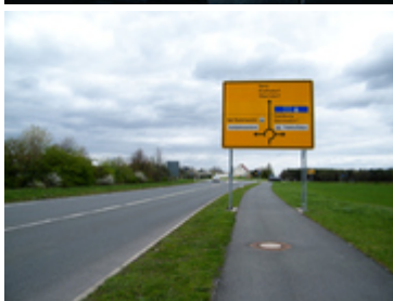
Bild 12 - Anfahrt zum Kreisverkehr neben der A4 AST