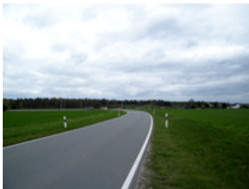
Bild 13 - Straße nach Bad Klosterlausnitz neben der A4