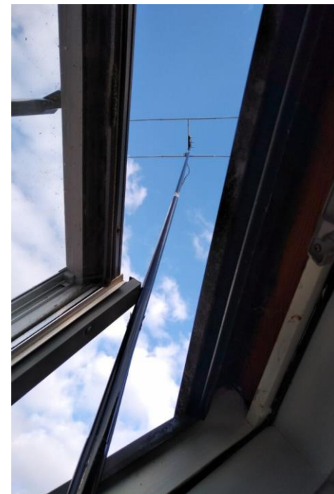
QRV auf 2m mit HB9CV (Homepage H24)