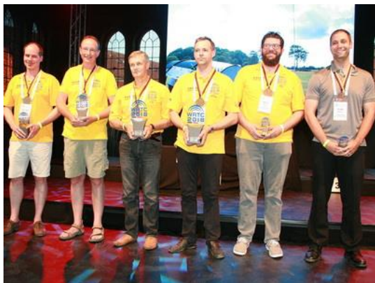
Sieger WRTC 2018