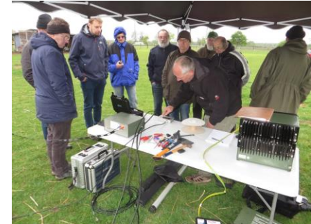
Antennentesttag (Homepage H24)