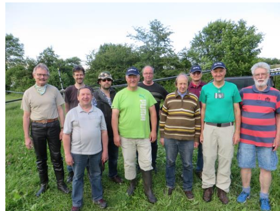
DM4G/P Team CW FD 2017