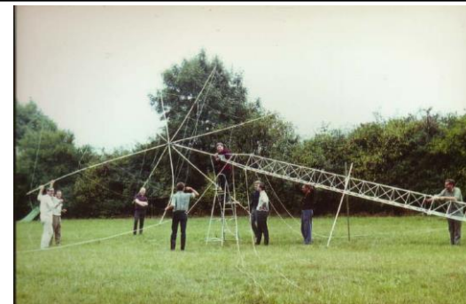
Fieldday bei H24 in den 70er (Homepage)