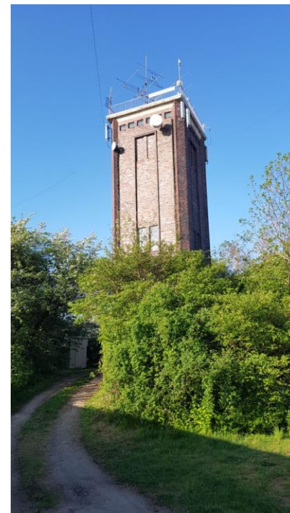
DL0VW (von Homepage)