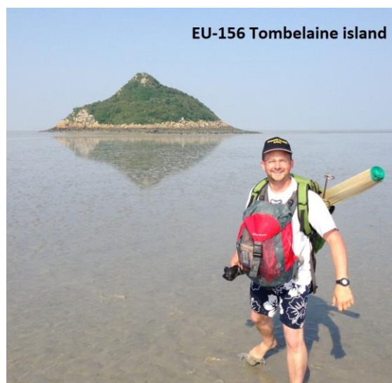
EU-156 Tombelaine island

Fuß auf die Insel gehen. Dabei werden zwei Flüsse überquert und die Wegstrecke ist ca. hin und zurück ca. 7km. Durch den Untergrund von Schlamm und Sand auf dem Weg braucht er für diese Strecke etwa 3 Stunden. Seine Ausrüstung ist ein IC-7300, eine Quad für 10 m, eine Vertikalantenne für 17 m und einen 100-Ah Akku. Die voraussichtliche Einsatzzeit am 31. August wird von 10:00 bis 12:30 Uhr und am 1. September von 11:00 bis 13:00 Uhr sein. Gil hatte die Aktivierung schon bereits 2010 unter dem Rufzeichen TM0INT und 2013 unter dem Rufzeichen F4FET/p durchgeführt. Die letzte Aktivität von dieser Insel war 2014. QSL via M0OXO